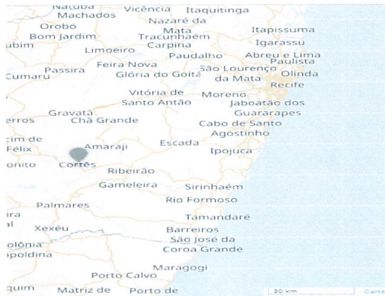
Localização de Cortês em Pernambuco

Franciely D. de Almeida Engenheira Civil CREA-PE 181957666-3