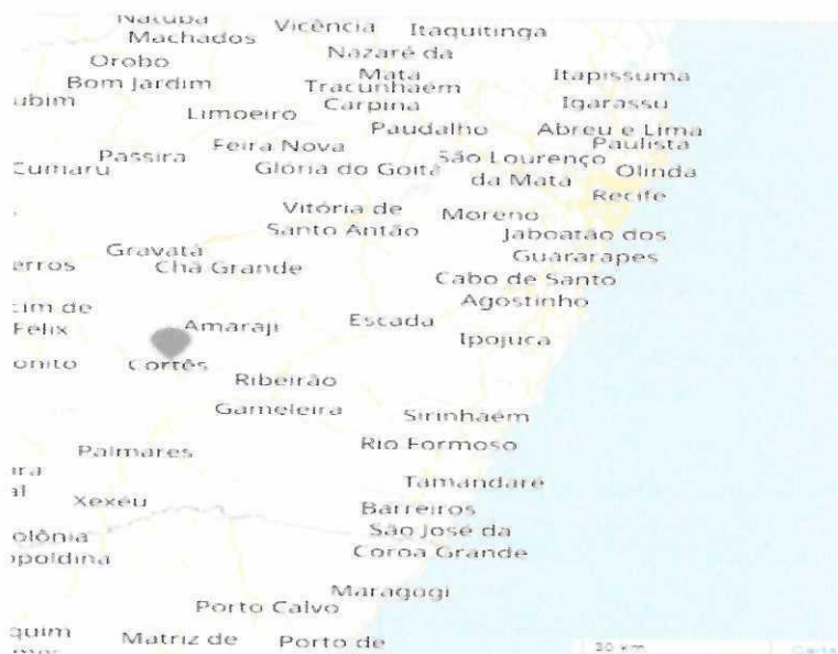
Localização de Cortês em Pernambuco

Franciely D. de Almeida Engenheira Civil CREA-PE 181957666-3